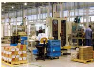
Fábrica Sabó (Mogi Mirim)

A frota de veículos cresceu! Segundo números do Sindipeças, já são mais de 30 milhões de veículos, com idade média de 8 anos e 10 meses - mais baixa que a da frota americana e próxima à de países como Alemanha e França. Desse total, 28% têm até três anos de uso. Para chegar aos 8 anos e 10 meses verificados em 2009, os brasileiros adquiriram 8,3 milhões de modelos 0-km. Desse volume, 3,1 milhões foram comprados no ano passado, muito em razão da redução do IPI e da facilidade de crédito.