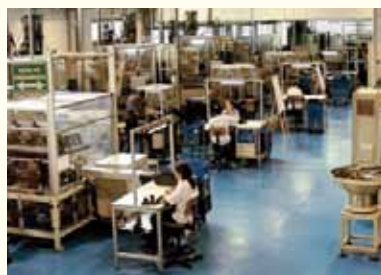
Fábrica Sabó (São Paulo)

E o que isso representa para o mercado da reparação independente? Resposta: mais serviços!