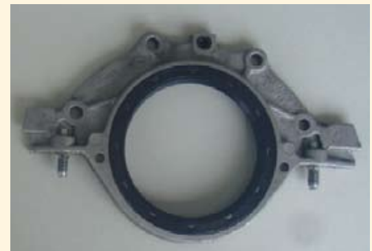
Flange de alumínio