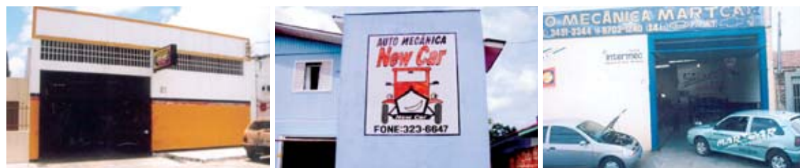
Aí estão elas: as três oficinas premiadas pela Promoção Reforma Total Sabó. Para conhecer um pouco mais sobre elas, vá até a página 4.

D iz o credo popular que as últimas coisas que você faz no ano anterior se repetem ao longo do ano seguinte! Isso explica (em certo sentido) um pouco o espírito de bondade, amizade e cooperação que se instala entre as pessoas no período entre o Natal e o Ano Novo. Verdade ou crendice, o fato é que a Sabó terminou o ano de 2007 do jeito que imaginou, ou seja, ao lado dos milhares de profissionais do mercado de reparação automotiva e reposição de autopeças, e começa 2008 ajudando a transformar o cotidiano de três oficinas, de tal forma que estas empresas entrem neste novo ano muito bem equipadas e mais bem preparadas para atender bem a seus clientes.